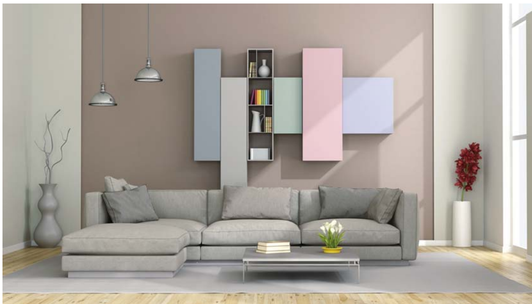
Розовый кварц, серенити, муссон, вулканический серый